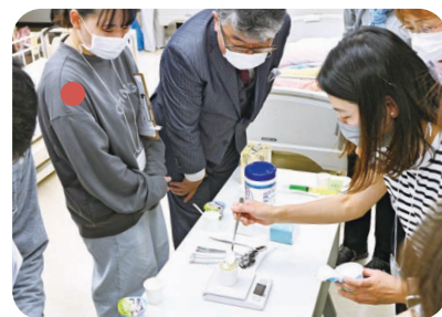
一口量 20g で体験しました。